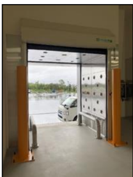
シートシャッター付き