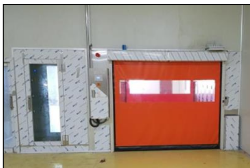
シートシャッター付き