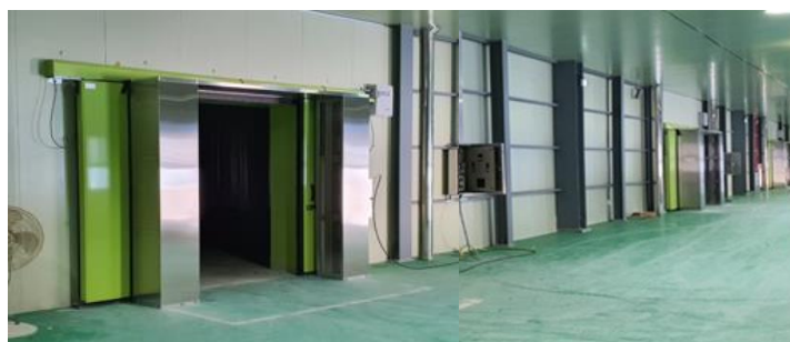
冷凍・冷蔵物流センター