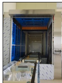
ベルトコンベア用