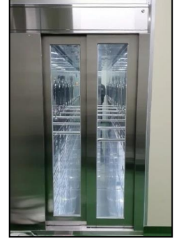
食肉工場(2重自動ドア)